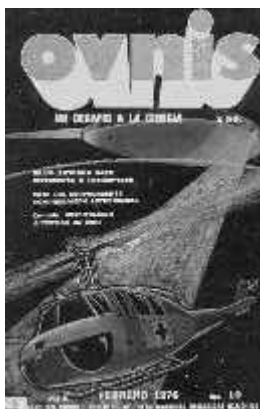
OVNIS N° 10 - Febrero de 1976

Hoy inauguramos una nueva sección permanente. La idea es, precisamente, invertir todas las semanas algo de tiempo en revolver nuestra voluminosa y amarillenta biblioteca (¡sí!. ¡Todavía tenemos una de papel!) entre libros, revistas, recortes periodísticos, boletines mimeografiados (¿recuerdan?) exhumando, en una especie de arqueología literaria hogareña, material que injustamente ha ido quedando relegado al olvido. Para esta generación de bits, es bueno refrescar ciertos conocimientos que demuestran que, después de todo, muchas veces estuvimos cerca de algunas respuestas hasta que los caminos se bifurcaron nuevamente.